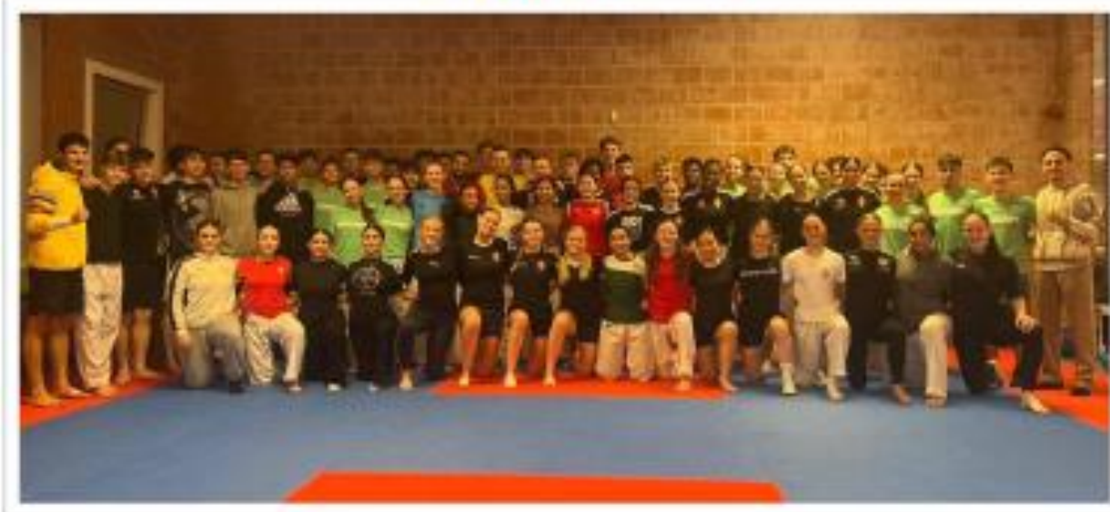
Le groupe des athlètes et coaches présents durant ce week-end

Le centre ADEPS de Loverval a accueilli du 17 au 19 janvier un événement sportif de grande envergure, réunissant les sélections nationales belge, hongroise et danoise dans le cadre de leur préparation pour les Championnats d'Europe U21, qui se tiendront en février prochain en Pologne.